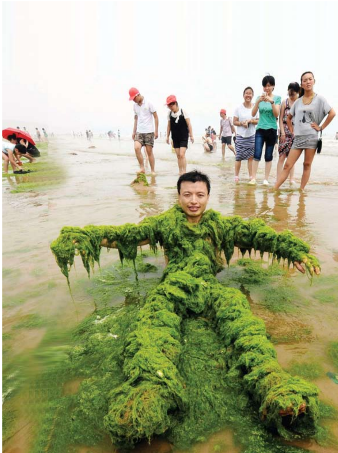
رجل يغطي نفسه بالطحالب على الشاطئ في مدينة تشينغداو بمقاطعة شانغونغ الصينية.