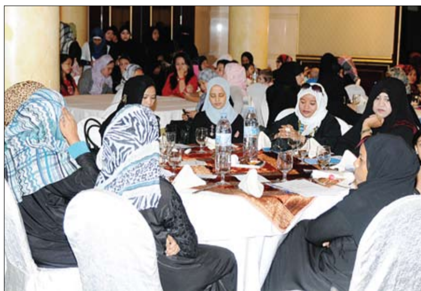
ضمن فعاليات مشاركة المجتمع