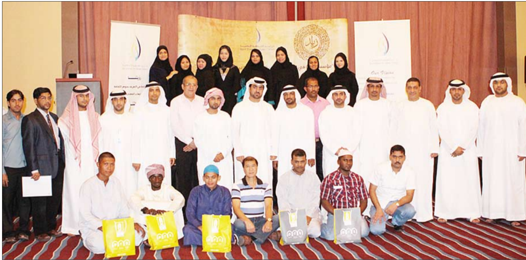
بحضور علماء من ضيوف رئيس الدولة